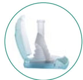
Leicht zu öffnen