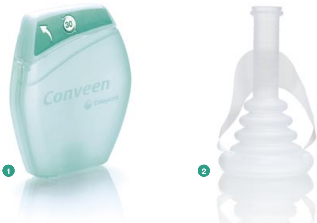
Conveen Optima – diskret verwahrt in der Compact-Box (1), ausgepackt (2) und abgerollt (3).